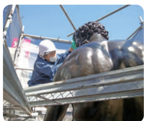
大和ミュージアム正面