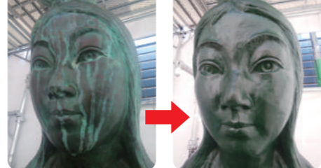
酸性雨の筋がキレイに無くなりました!(シシンヨー本店)

◆お仏壇の修理・掃除・洗浄・塗替え・買換え・移動・保管・処分 ◆お仏具・お数珠・寺院関連・おみこし・掛軸などの修復