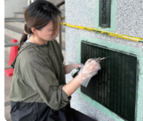
妻も銘板を塗装中(山陽高校)