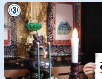
火を使わずにLEDライトにすることも考えましょう。