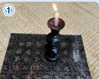
お仏壇の中ではなく、少し離れた所で火をつけましょう。

ロウソクによる火事の対策には、①「 外で灯す 」②「 防災マット 」③「 LED 」をお勧めしています。マットやLEDは当社でご用意できますので、お気軽にお問い合わせください。